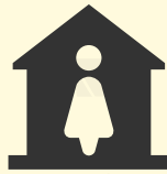
b) mujeres jefas de hogar

Ambos iconos se han incorporado a varios mapas verdes. Entre estos, el relacionado con el emprendimiento de mujeres en diversos oficios en el Consejo Popular Los Pinos , provincia de Artemisa, los cuales reflejan la incorporación de las féminas a las nuevas formas económicas. Acciones que, sin dudas, las empodera.