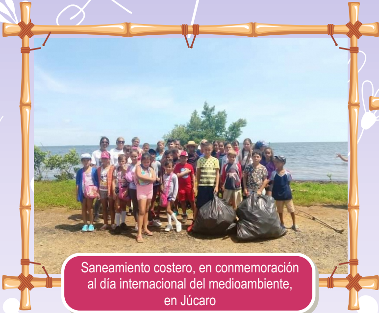
Saneamiento costero, en conmemoración al día internacional del medioambiente, en Júcaro