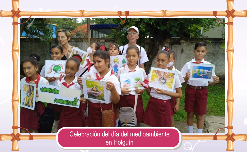
Celebración del día del medioambiente en Holguín