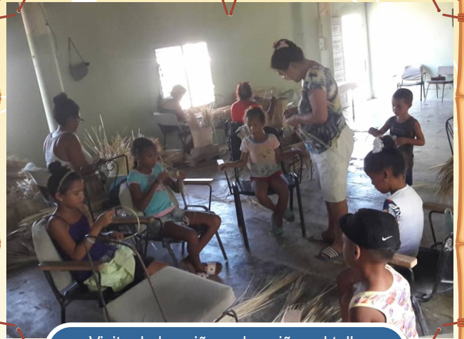
Visita de los niños y las niñas al taller de artesanía de su comunidad El Yarual