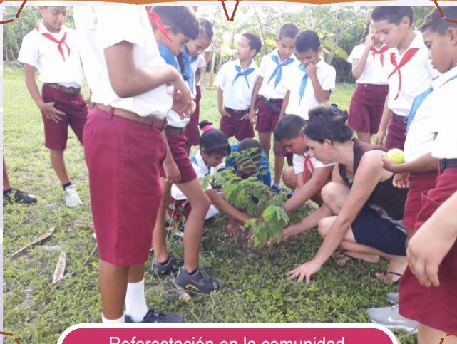
Reforestación en la comunidad del Yarual, en conmemoración al día del medioambiente