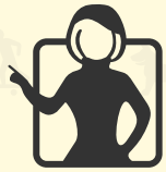
a) mujer empoderada

Iconos que reflejan la perspectiva de género: