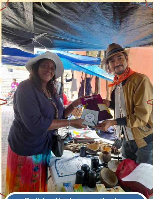
Participación de la coordinadora del nodo de Marianao en la feria de consumidores y productores en México