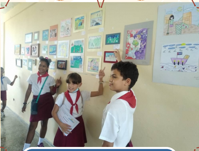
Premiación del Concurso municipal Soñando mi comunidad , de Habana del Este