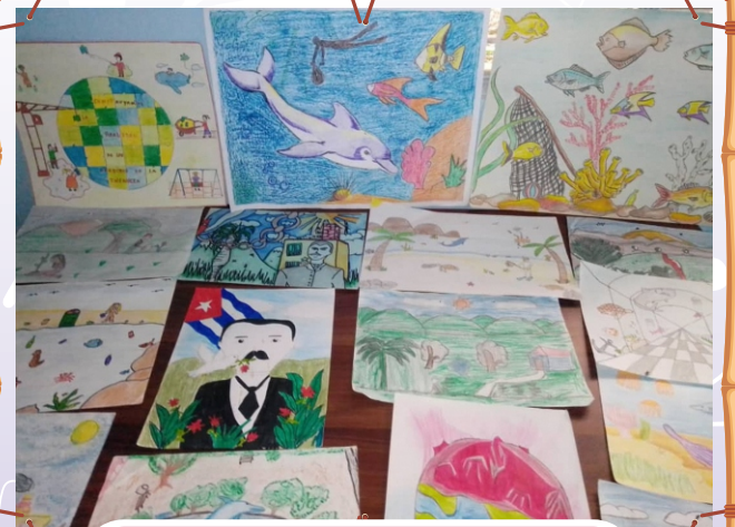
Trabajos del Concurso en conmemoración al día internacional del medio ambiente en la escuela Victoria de Girón, Nuevitas