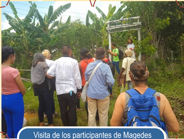
Visita de los participantes de Magedes al patio solidario Alegría de Vivir, Consolación del Sur