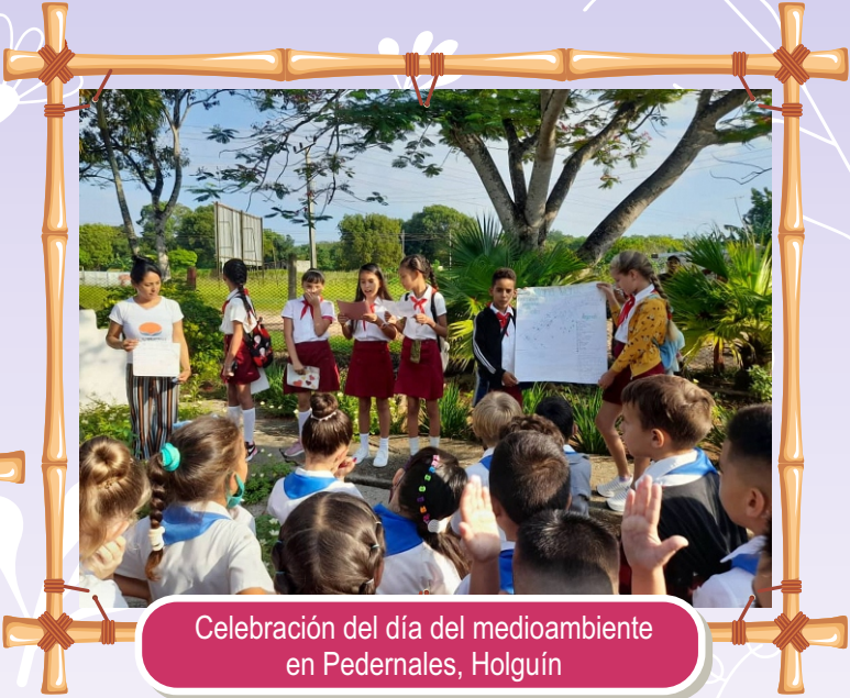
Celebración del día del medioambiente en Pedernales, Holguín