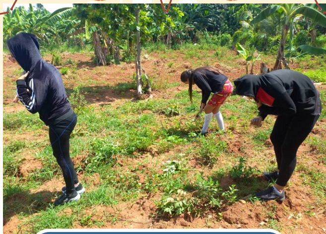
Estudiantes del Preuniversitario Jose Licourt, en actividad socioproductiva, en un patio solidario de San Cristóbal